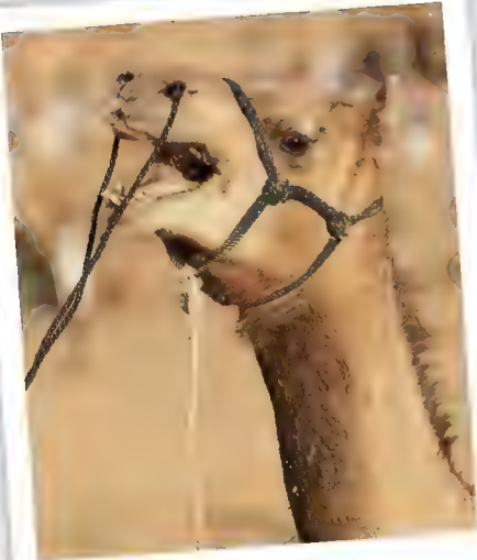
بواسطة خبلٍ مُعلَّقٍ بالنخريين، يقودُ الجِمالُ حيوانه.